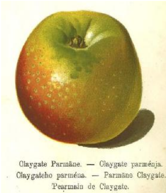
R.Stoll 1888 Pomologie en Autriche.